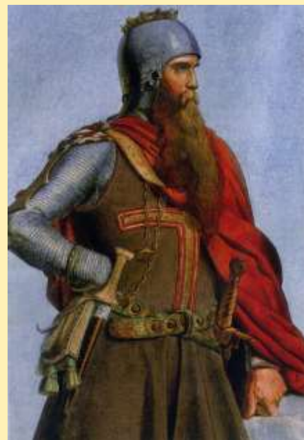
↑ Im Bild: Friedrich I. Barbarossa

1188 zieht der Pernegger Graf Ekebert mit Gefolge nach Göttweig, um dem Passauer Bischof Diepold die beiden Klöster Pernegg und Geras zu übergeben und im Gegenzug diese als Lehen mit Schirmherrschaft zurückzubekommen – als Zeugen mit dabei (u.a.) Hugo de Karelstete (Karlstein), Albero von Drosendorf sowie Otholfus und Einwig von Wicarslach (Weikertschlag).