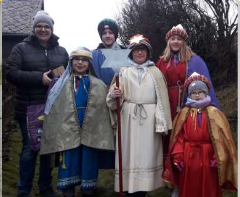
↑ Die Sternsinger von Obergrünbach .