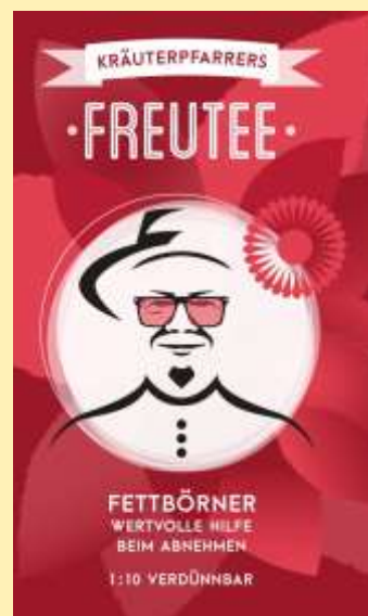
Verkosten Sie unseren neuen Freutee zum Verdünnen im Naturladen