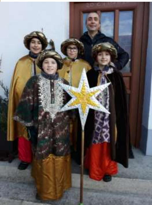
In Schlader machen sich vier Sternsinger auf den Weg.