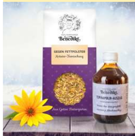
Topinambur-Auszug und ein bewährter Kräutertee unterstützen Sie beim Entgiften und Entschlacken

Unsere Mitarbeiterinnen im Naturladen stellen gerne ein individuelles Package für Ihr Wohlbefinden zusammen. Kommen Sie einfach bei uns vorbei (DI bis FR von 9 bis 17 Uhr und SA von 9 bis 12 Uhr) oder informieren Sie sich in unserem neuen Webshop über die aktuellen Kräutergebote: www.kraeuterpfarrer.at