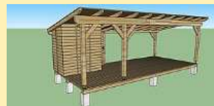
Im Bild: Skizze des neuen Pavillon

Bei der Projektpräsentation in der alten Volksschule bedankte sich Bgm. Siegfried Walch für die Erweiterung des Gartens und lobte die Leistung der Jugend, die nicht unterschätzt werden darf.