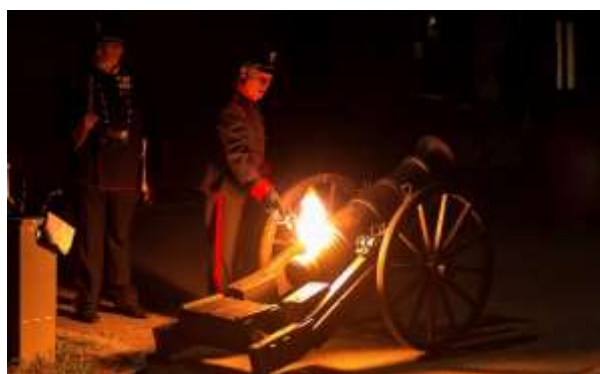
Im Bild: Das Bürgerkorps Eggenburg feuerte die Kanone ab