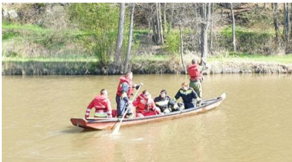
24h Übung 2023