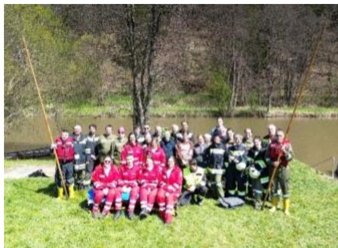
24h Übung 2023

Die letzten Jahre haben uns gezeigt, dass solche Übungen von enormer Wichtigkeit sind und den Zusammenhalt stärken. Nur wenn eine Hand in die andere Hand greift, kann rasches und sicheres Handeln im Ernstfall gewährleistet werden.