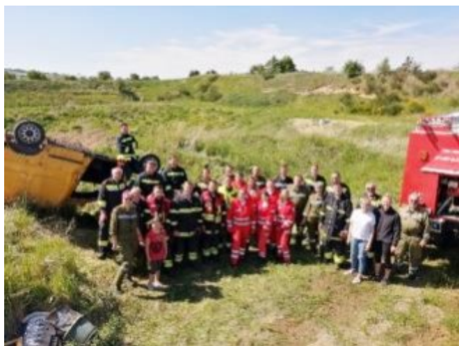
24h Übung 2022

Eine weitere Tradition aus unserem Übungswesen wird am 19. und 20. April 2024 stattfinden. Unsere 24-Stunden-Übung steht auf dem Programm und wir sind schon gespannt, wie unsere Ausbilder wieder kreative und realitätstreue Szenarien entwickeln, welche die Kamerad*innen nicht nur fordern, sondern auch fördern werden.